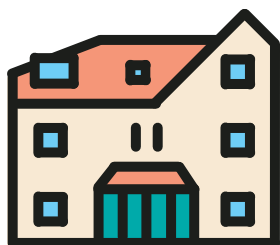
Waar staan we nu?

Het belangrijkste voor u om nu te weten en wat u leest in deze brief: