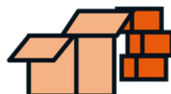
Gewenste volgorde van uitvoering